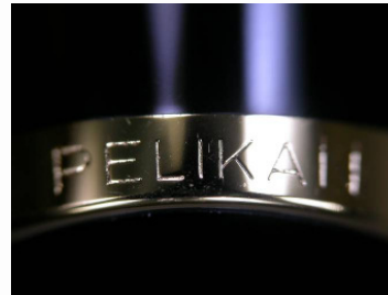
Nach der Reinigung