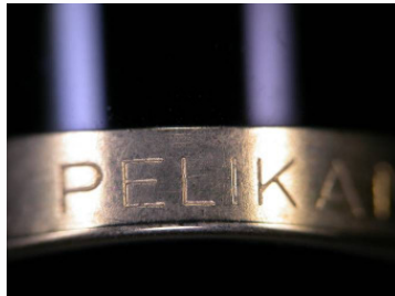
Vor der Reinigung