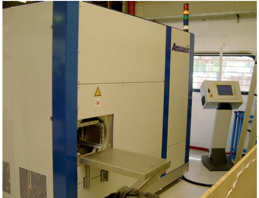
Machine de nettoyage «Egaclean 4100»

Les tests de qualité du lavage ont permis de définir que la couche résiduelle d'hydrocarbure (il ne s'agit évidemment pas d'une couche grasse) est d'en-